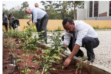
PM Abiy Ahmed plant zijn bomen

https://www.thehindu.com/news/international/ethiopia-plants-more-than-200-million-trees-in-1-day/article28767237.ece