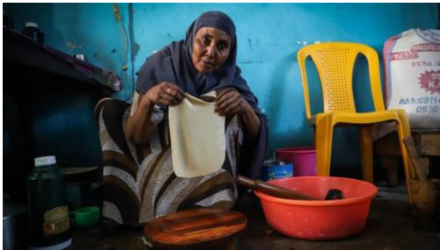
Hukun bereidt injera en andere snacks

https://www.aljazeera.com/indepth/features/islamic-banking-ethiopia-offers-muslims-financial-inclusion-190404192204542.html