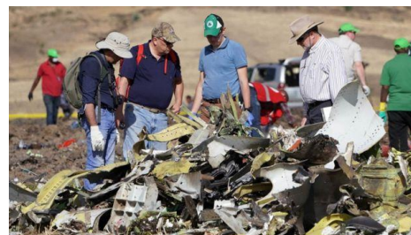
Team van experts aan het werk