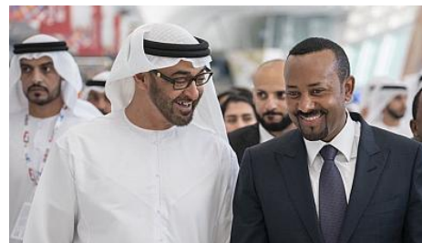
Kroonprins Mohamed Ibn Zayed en Abiy Ahmed