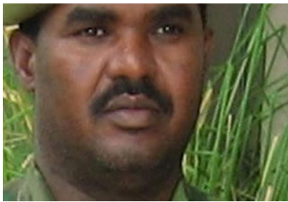
Brigadier-generaal Kemal Gelchu

Kemal Gelchu, ontslagen. Een reden is niet gegeven. Kemal Gelchu vocht vroeger bij het Oromo Liberation Front. Volgens mediaraapporten vond hij dat de Oromo Democratic Party (ODP), de partij van Lemma Megersa, teveel invloed wilde hebben op het veiligheidsbeleid.