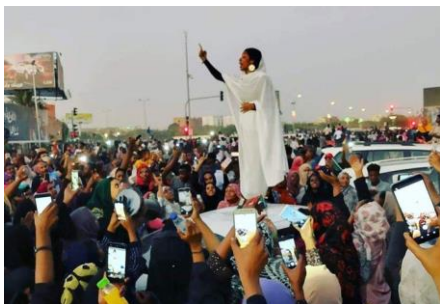
Alla Salah in Khartoum

De International Crisis Group bepleit dat PM Abiy Ahmed zijn Egyptische en Sudanese collega's uitnodigt voor een bezoek aan de Grand Renaissance Dam. Egypte moet ophouden om vanuit het buitenland in Ethiopië operende verzetsgroepen te steunen, als het zijn zin rond de dam niet krijgt.