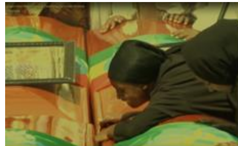
Nabestaande bij kisten slachtoffers

https://www.africanews.com/2019/04/11/a-month-since-ethiopian-et302-crash-10-events-worth-noting/