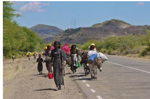
Weg van Kombolcha naar Addis Abeba

https://www.nederlandwereldwijd.nl/landen/ethiopia/reizen/reisadvies