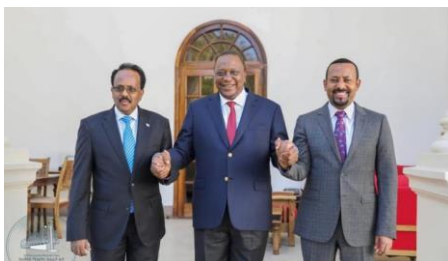
V.l.n.r. de presidenten Md Abdullahi (Somalië) en Uhuru Kenyatta (Kenia) en PM Abiy Ahmed

https://nos.nl/artikel/2279942-leger-sudan-zet-president-bashir-aan-de-kant.html