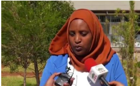
Burgemeester Habiba Siraj

versie. Sommigen wonen er al sinds eind jaren 90. Volgens de gemeente is de grond nodig voor de bouw van scholen en klinieken en voor de aanleg van groen. Er staan nog 9.000 huizen op de lijst om te worden verwijderd.