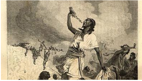
Keizer Tewdros pleegt zelfmoord om niet in Britse handen te vallen

https://www.nam.ac.uk/press/national-army-museum-responds-repatriation-request-ethiopia