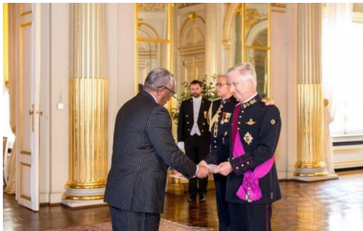
Ambassadeur Grum overhandigt zijn geloofsbrieven aan koning Filip.

United Kingdom (1899), 1900 (The United States) and 1906 (Belgium). 1