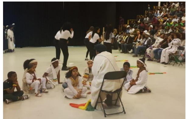
Herdenking in Utrecht

https://www.thereporterethiopia.com/article/reliving-adwa-tracing-footsteps-patriots