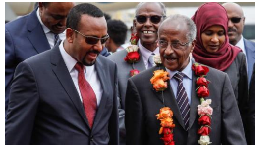
L: PM Abiy Ahmed; r: Min. Osman Saleh van Buitenlandse Zaken van Eritrea

Het lijkt erop, dat de nieuwe regering vrede en welvaart nastreeft in de gehele Hoorn van