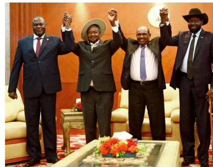
V.l.n.r. Riek Machar; President Yoweri Museveni, President Omar al-Bashir and President Salva Kiir.

https://martinplaut.files.wordpress.com/2018/06/khartoum-declaration.pdf