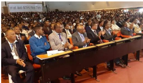
Oprichtingsvergadering Ethiopian Citizens for Social Justice . Ziet iemand hier een vrouw?

Zeven politieke partijen, waaronder Patriotic Ginbot 7 , Ethiopian Democratic Party (EDP), All Ethiopian Democratic Party (AEDP), Semayawi Party , New Generation Party (NGP), Gambella Regional Movement (GRM) and Unity for Democracy and Justice (UDJ) party zijn samen gegaan in de 'Ethiopian Citizens for Social Justice'. Onder deze naam nemen zij deel aan de verkiezingen van volgend jaar. Groot-Brittannië geeft 15,5 miljoen pond om die verkiezingen transparanter en veiliger te laten verlopen.