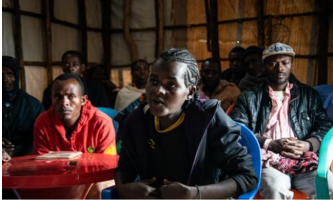
Moeder van zes kinderen bang ...

verantwoorden. De regering heeft begrip voor de angst bij terugkeerders voor nieuw etnisch geweld, maar garandeert hun veiligheid. De terugkeer gebeurt volgens een regeringswoordvoerder op basis van 'vrijwilligheid'. Bij terugkeerders en hulporganisaties bestaan twijfels over de aanpak.