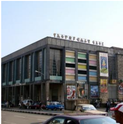
Huidige Nationale Theater

https://allafrica.com/stories/201904160734.html