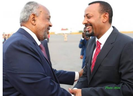
President Ismail Omar Guelleh, Djibouti en Premier Abiy Ahmed

daarover gesproken met de Saoedische Kroonprins Mohammed bin Salman.