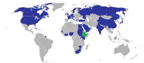
Overzicht ambassaden netwerk Ethiopië

Ter versterking van zijn diplomatieke netwerk opent Ethiopië ambassades in Tanzania en Nederland. Enkele maanden geleden ging een ambassade in Indonesië open. Een belangrijke taak van de nieuwe posten wordt het aantrekken van buitenlandse investeerders.