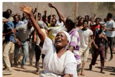
Vreugde over vrijlaten gevangenen

https://ethiopianembassy.be/en/2018/04/27/ethiopia-to-introduce-term-limits-for-the-office-of-prime-minister/